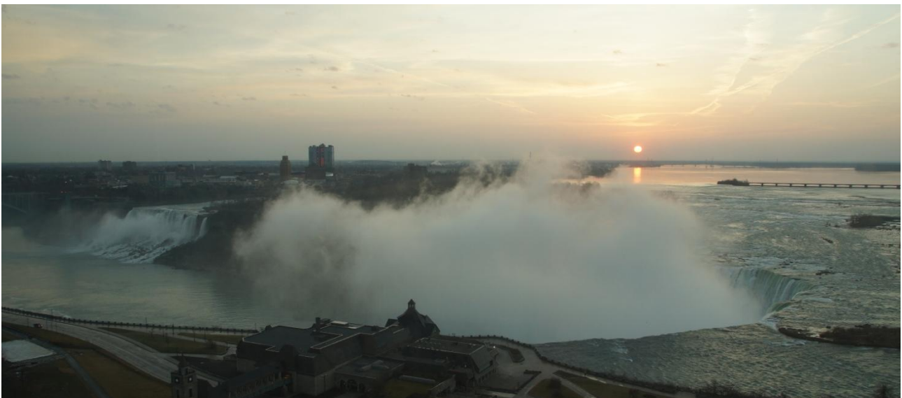
Morgenudsigt fra hotellet, ikke værst.

Kjesten: Jeg havde også været vågen flere gange i nat for at betragte det smukke syn. Selv i mørke var det imponerende. De mange millioner af liter vand, der blot buldrer lystigt af sted hele døgnet! Vi havde haft en frygt eller forudelse om, at noget af vandfaldet villet være frosset, men siden vi fløj over det for ca. 2½ uge siden på vej til Havana, har vejret åbenbart været på den gode side, for der var ikke spor af is i modsæt-