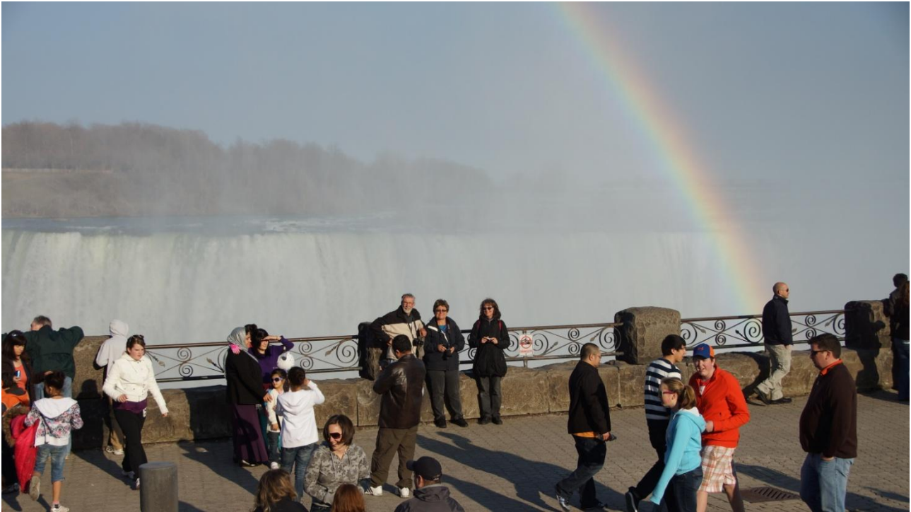
Niagara Horse Shoe.