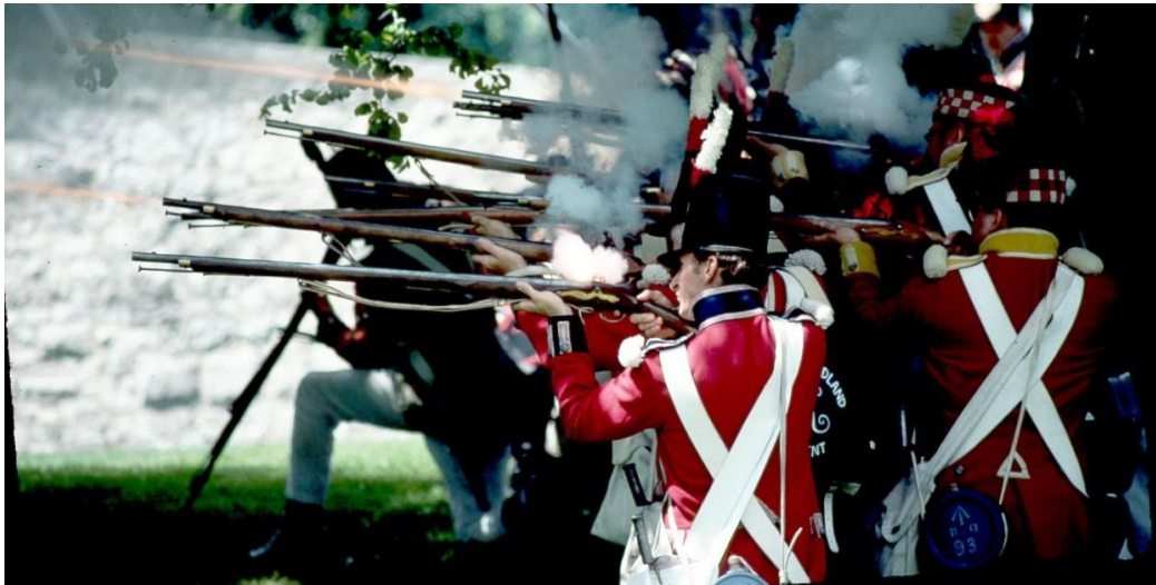
Slaget ved Fort Erie 1812.

Bent: Vi havde aftalt med ejeren på Express Inn, at vi bare kunne forlade værelserne og lægge nøglen på værelset. Han tippede vores alder til at være godt over lømmelalderen, så han fandt det ikke nødvendigt at inspicere værelserne inden vores afgang. Vi forlod stedet ca. kl. 8:00 og kørte ind mod Niagara for at finde et sted at spise morgenmad. AiMaes buffet til $6,99 for morgenmad (all you can eat) var også tilbuddet i dag. De tjener helt klart penge på os; anderledes står det måske til, når det drejer sig om nogle af canadierne, vi spiser som fugle i forhold til flere lokale, vi har iagttaget. Vi kørte derfra mod syd, ned mod Lake Erie (ofte forekommende sø i kryds og tværs). Vi holdt ved Fort Erie, hvorfra vi kunne se Peace Bridge i morgentågen. Peace Bridge fører over Niagara River til USA. Stedet dannede i 1812 rammen om det mest blodige slag i Canadas historie. Vi gik lidt rundt om fortet, gæstecenteret var lukket, sæsonen er ikke startet endnu her. Vi har i dag hørt, at der var snestorm sidste fredag.